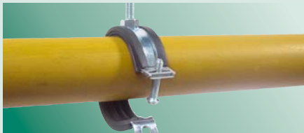
поместить трубу в хомут