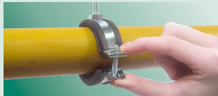
закрыть хомут / нажать на болт